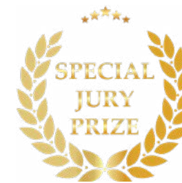
Cannes 2024 FESTIVAL D'ART PYROTECHNIQUE