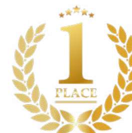
Montreal 2018 FIREWORKS FESTIVAL